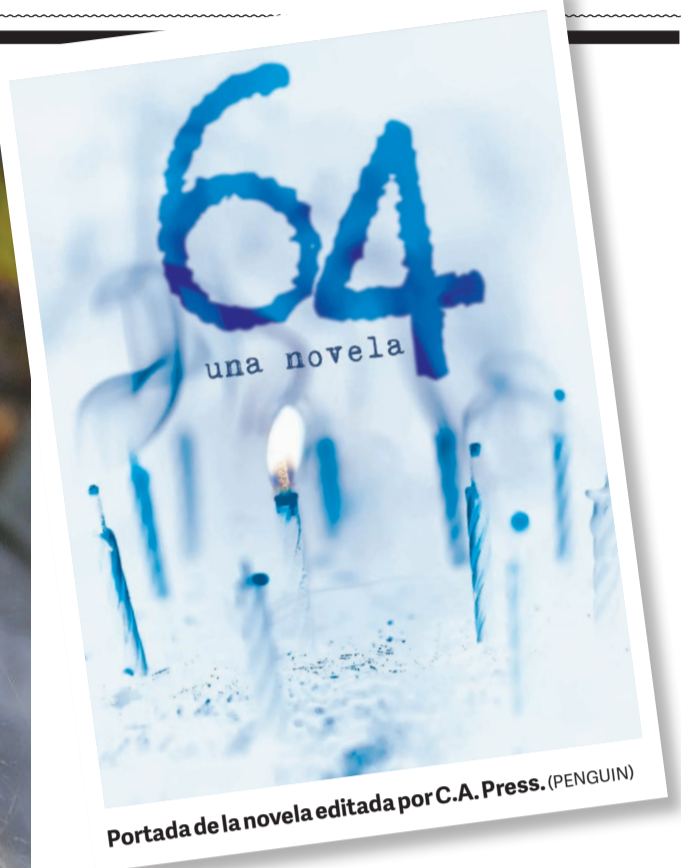
Portada de la novela editada por C.A. Press. (PENGUIN)

Sigal Reitner-Arias vive en las afueras de Nueva York con su esposo y sus tres hijos. (MARIELA MURDOCCO)